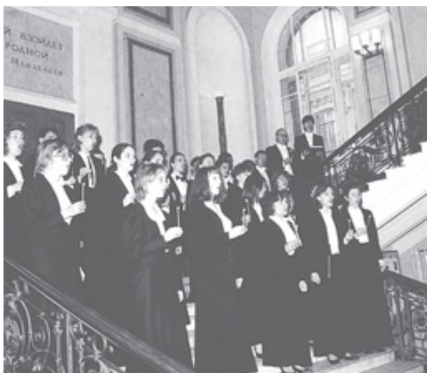
El famoso coro estudiantil en una escalera de la universidad que tiene siglos de antigüedad.

Desde 1991-1993, en Moscú y en Tomsk (Siberia), los profesores del Departamento de Desarrollo Sustenta-