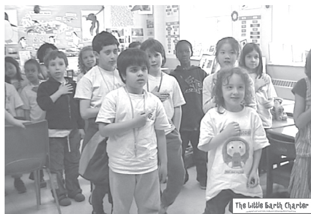
Aprendiendo acerca del lugar que ocupamos en el mundo.

El programa de la PCT ofrece una variedad de actividades como juegos originales como modos prácticos para enriquecer y consolidar el aprendizaje de los estudiantes al