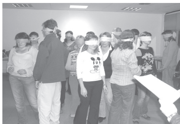
Taller en el CEFIRE de Elche- un centro de entrenamiento para profesores

La capacitación a maestros de preescolar y primarias se realizó de diciembre de 2006 al mes de abril de 2007 (para continuar en el periodo 2007-2008), en dos escuelas seleccionadas del municipio de la Comunidad de Madrid. Estas escuelas se escogieron con prioridad debido a que la población se compone de migrantes, etnias minoritarias y gitanos. El objetivo del taller (26 horas y dos horas por semana) sirve para promover la educación en valores universales, familiarizar al personal de cada escuela con la Carta de la Tierra y ayudar a otros a generar ideas y proyectos para explorar los 16 principios. Los talleres continúan con horas adicionales de consulta y asistencia para preparar iniciativas y proyectos en el ciclo escolar 2007-2008. Se comparten conferencias e información con las familias del área de apoyo de educación sustentable a cargo de los propios estudiantes. De esta manera, las familias y el personal se involucran en actividades promovidas por los niños.