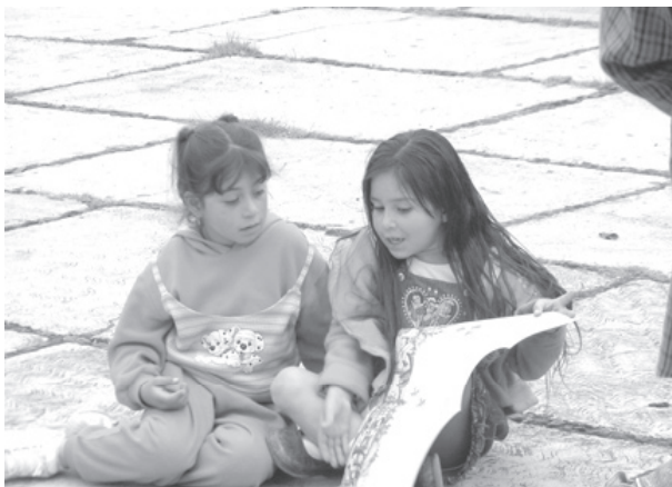
Taller en la comunidad Tenencia Lázaro Cárdenas.ww