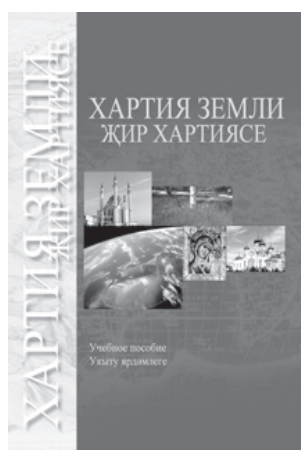
Libro de texto La Carta de la Tierra para Escuelas Secundarias publicado por el Ministerio de Educación de Tatarstán

Además de estos concursos, hay muchas oportunidades de aprendizaje y acción para los estudiantes. Hay más de 200 escuelas-protectoras de áreas forestales, donde los estudiantes prestan ayuda tangible a guardias forestales y biólogos – plantando nuevos árboles, creando cinturones verdes y recogiendo hierbas medicinales silvestres. Los estudiantes organizan concursos, pruebas y discusiones con los miembros de sus comunidades; montan obras de teatro ambientales; llevan a cabo exhibiciones; limpian parques y jardines; plantan nuevos árboles; limpian territorios escolares y comunidades vecinales; cuidan los manantiales de los bosques; sostienen conferencias sobre consumismo; y crean, publican y distribuyen panfletos educativos que promueven el modo de vida sustentable.