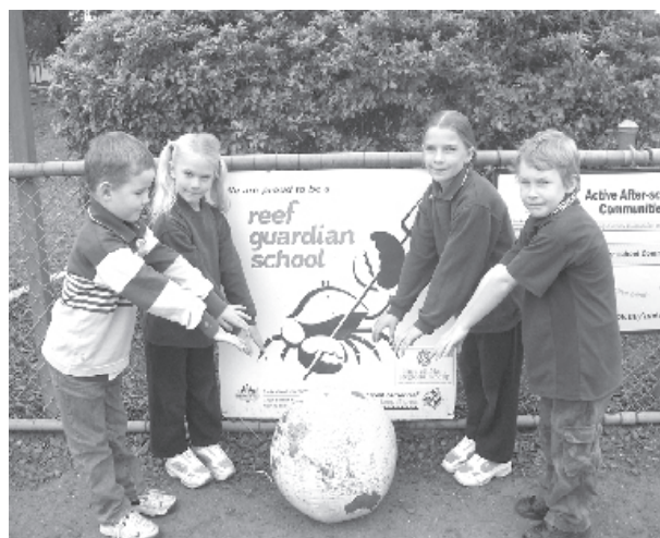
Aprendiendo acerca del lugar que ocupamos en el mundo.

Las implicaciones para la comunidad escolar, si todos los miembros siguen estos cuatro principios, significan un reto emocionante. Creemos que el entendimiento y la adherencia a estos principios pueden aumentar significativamente el potencial de compromiso de los estudiantes para el aprendizaje en la vida real y mejora su desempeño escolar.