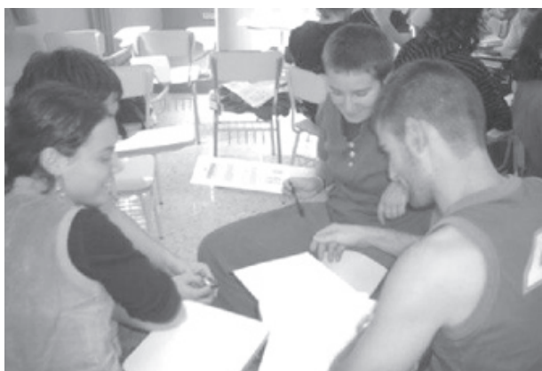
Presentación del proyecto - POPBL.

En Septiembre del 2006, me presente ante el grupo de estudios en Praxiología del Instituto Nacional de Educación Física en Cataluña (INEFC) en la Universidad de Lleida, y presente una propuesta para diseñar un catalogo descriptivo de juegos tradicionales, bailes y ejercicios físicos desde una perspectiva científica. Diseñado para utilizar la Praxiología motriz- La Ciencia de las funciones motoras- en congruencia con los valores contenidos en