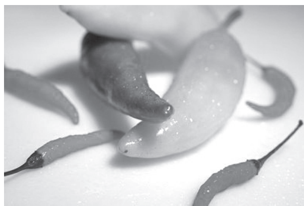
Fotografía tomada por un estudiante. Fotografía multimedia.

A los estudiantes inscritos en fotografía multimedia II, impartida por Tim Gleason, se les presenta la Carta de