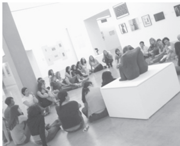
Actividades durante el taller.

7.Algunos resultados. A partir de las manifestaciones de algunos participantes es interesante saber sus contribuciones para aumentar el número de personas conscientes participantes en actividades sustentables. Estudiantes universitarios que trabajan con niños (en preescolar y educación básica) como resultado de nuestra presentación y reflexión de las opciones metodológicas con la Carta de la Tierra. Otros estudiantes se han basado en la Carta de la Tierra para escribir su tesis o trabajos relacionados con la educación para la sustentabilidad, ética y eco-pedagogía. Algunas instituciones (ONG y gobiernos locales) han solicitado cursos y capacitación motivados por experiencias positivas de sus colegas. Frecuentemente sabemos de historias y recibimos correos electrónicos de gente que quiere realizar un trabajo educativo con estas metodologías para difundir los valores de la Carta de la Tierra y la educación para la sustentabilidad.