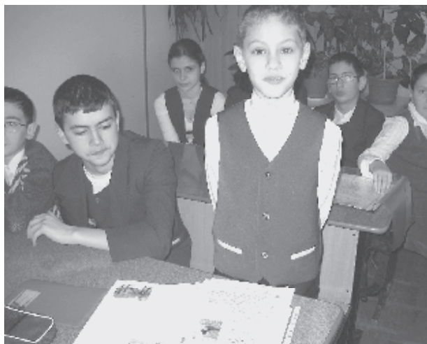
Mini proyecto "La energía es nuestro futuro". Niños de cuarto grado.

Inspirados por esta experiencia, los estudiantes diseñaron una mini campaña, "El Danubio: El río junto a nosotros" e invitaron a un asociado local, el Centro de