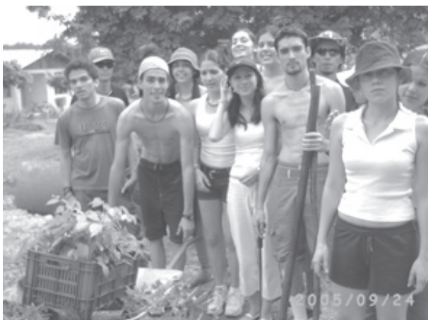
Proyecto de reforestación realizado por estudiantes de CNG en Puerto Jesús Guanacaste.

críticos y objetivos, ya que la Carta sirve como canal de apertura para la reflexión en temas modernos, desde lo holístico hasta la perspectiva interdisciplinaria.