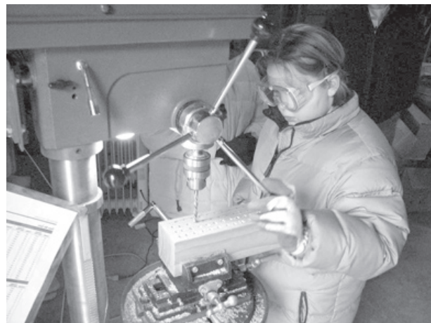
Aprendizaje de diferentes habilidades.

Voyager organiza sus seis grados de primaria en dos clases de múltiples edades, “junior y sénior”. Los maestros son expertos en el método y los temas, y dirigen la enseñanza a través de la facilitación y alentando la curiosidad natural de los niños por el aprendizaje divertido.