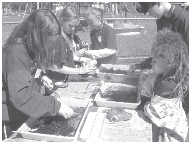
Aprendiendo sobre diversidad.

Los estudiantes comenzaron esta unidad investigando cómo los niños viven en otras partes del mundo a través del internet y otros recursos en línea. Los resultados de su búsqueda culminaron con la creación de una presentación en PowerPoint sobre la Carta de la tierra, sustentabilidad y formas de construir un mundo sustentable.