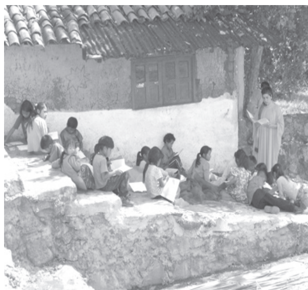
Taller en la comunidad de la colonia Revolución.

Los talleres de cultura ambiental Encantamiento para hacer crecer gusanos brillantes se realizaron en cada uno de los diez CODECOS y sus comunidades donde se incluyen actividades como baile y cuenta-cuentos “Pies de trapo” y la Carta de la Tierra. En febrero de 2007 parte de los resultados se cristalizaron en un manual básico y una memoria gráfica que se distribuyeron para compartir (y reproducir) las experiencias de los maestros y promotores culturales.