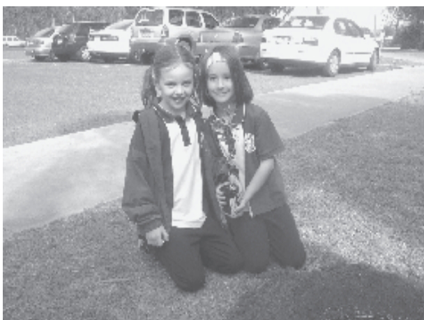
Aprendiendo acerca del lugar que ocupamos en el mundo.

Ciencia en Acción es líder en estrategias de la Fase Media de Aprendizaje en la Escuela Estatal de Wondai P10 y es una historia de éxito en curriculum. Es una ciencia ambiental optativa que investiga asuntos locales con base en el modelo de acción-investigación. Se logra a través de modelos de enseñanza con prácticas en la vida real. Nuestro acercamiento comprende el primer pensamiento abstracto de nuestra gente joven sobre los asuntos globales relacionándolos directamente a los problemas ambientales que la localidad enfrenta. Ciencia en Acción siempre ha estado enmarcada por los principios de la Carta de la Tierra, a pesar de que no lo reconozcamos formalmente. La implementación de la Carta de la Tierra en nuestro plan académico ha añadido una dimensión positiva; los estudiantes son capaces de notar claramente la importancia de su trabajo en términos del impacto global. Refuerza la idea de que todos tenemos parte en la creación de un futuro sustentable y que cada acción positiva contribuye al bienestar de nuestro planeta y sus habitantes.