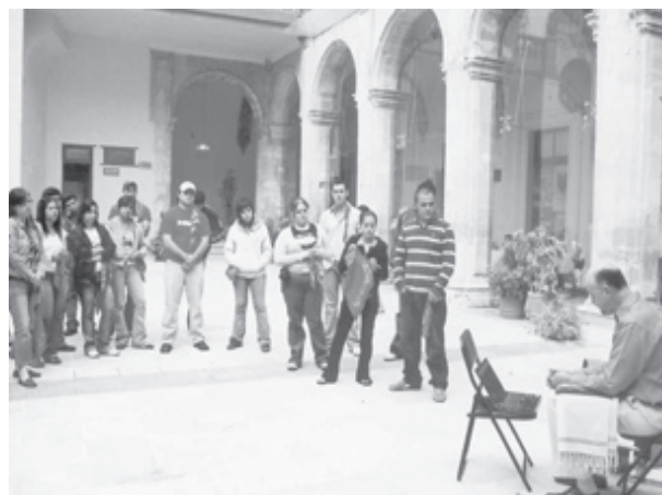
Taller de la Carta de la Tierra. Universidad de Guanajuato.

Complexus también ha redactado una serie de documentos, incluyendo una declaración de apoyo dentro