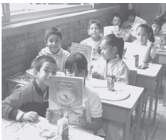
Estudiantes y profesor platican sobre temas relacionados entre sí.