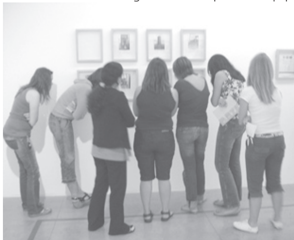
Lectura de los principios de la Carta de la Tierra.

4. Cara a cara. Dividimos al grupo en tantos equipos como sea necesario, asegurándose de que cada equipo