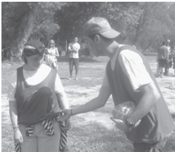
La Carta de la Tierra en Acción Motriz en el parque Mitjana.

Por un día, profesores universitarios, gente mayor de centros municipales, profesores y estudiantes del sistema de escuelas secundarias (ESO), gente con discapacidad cognitiva, técnicos ambientales de la ciudad de Lleida y