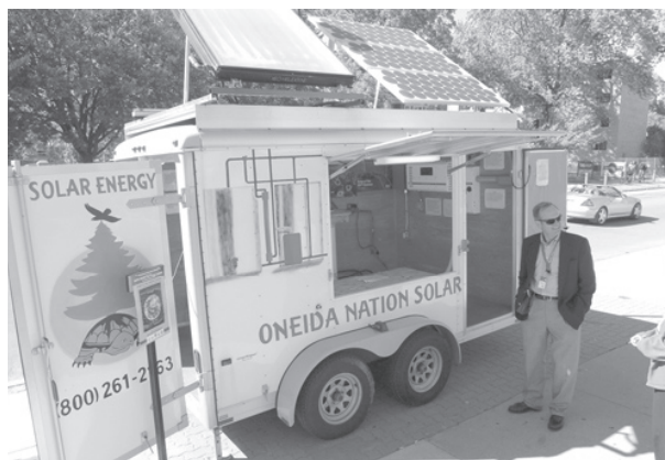
Exhibición de fuentes alternativas de energía.

En los últimos años, la UW Oshkosh ha recibido reconocimiento nacional por sus proyectos en la conservación de energía y recursos. Entre sus logros está el Premio al Campus Ecológico de la Federación Nacional de Vida Salvaje 2003-2004 y el premio Estrella de la Energía 2005 por sus logros en el ahorro de energía. En la primavera del 2006, la UW Oshkosh recibió el Premio al Aire Limpio de Wisconsin del Departamento de Recursos Naturales y la Asociación de Wisconsin para el Aire Limpio. Algunos de estos premios están asociados con el compromiso universitario de mantener un porcentaje en el consumo