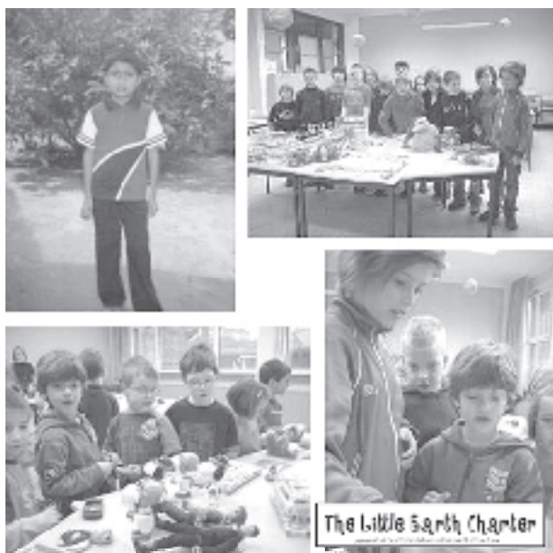
Estudiantes de la Escuela De Kriebel en Olen, Bélgica.