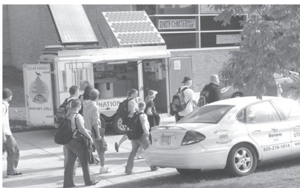
La Carta de la Tierra en la Universidad de Wisconsin Oshkosh.

Siguiendo el primer Encuentro con Comunidades de la Carta de la Tierra en el 2001, la Carta de la Tierra fue patrocinada por los cuatro elementos de la UW – facultad, estudiantes, personal académico y personal clasificado. Los administradores de mayor rango en la Universidad, incluyendo al Canciller dieron su apoyo entusiasta. Este fue el principio de un enfoque significativo hacia la sustentabilidad en el campus y el nexa con una comunidad más amplia. La sustentabilidad es ahora una de las “ideas de gobierno” de la universidad junto con la colaboración y el compromiso.