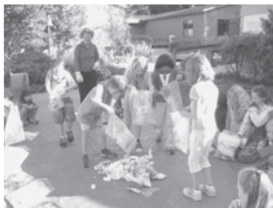
Chicos aprendiendo acerca del manejo de desechos.

El personal de Voyager vio la película de Al Gore “Una verdad incómoda” y sintió la urgencia de tocar temas