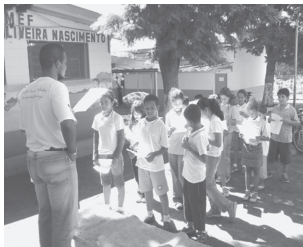
Estudiantes y profesor trabajan temas relacionados entre sí.

Por ejemplo temas de raza, género, religión, desarrollo sustentable, miseria, hambruna, salud, acceso a la información, violencia, justicia social y económica, y paz, los cuales han sido identificados como áreas de preocupación dentro del desarrollo de las escuelas. Se ha hecho claro que maestros y estudiantes están muy consientes de estos temas que deben ser abordados para así lograr sus – y nuestros- objetivos comunes de éxito.