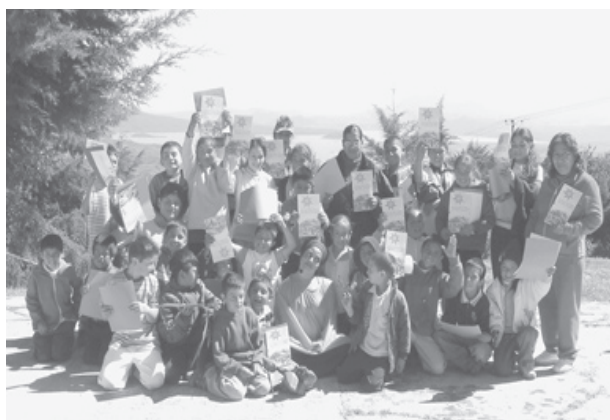
Actividades en la comunidad La Zaramora.

El tema se refuerza en cada acción y se puede incorporar gradualmente la crítica, las reflexiones acerca de lo que se hizo para construir y lo que se hizo para destruir. Analizar ambas y visualizar hacia dónde nos dirigimos. Por ejemplo, cuando nos ocupamos, el resultado es reproducción, y cuando destruimos, el resultado es extensión. Es posible utilizar las mismas acciones y variar el tema. Por ejemplo: en lugar de trabajar sobre animales, dibujar y describir gente y plantas de tu comunidad. Lo interesante son las variables en diversas locaciones de la comunidad. Es importante considerar que las diferencias, variaciones, mezclas y metáforas, las cuales constituyen la sal de la vida. Son bienvenidas cualquier expresión de danza, tea-