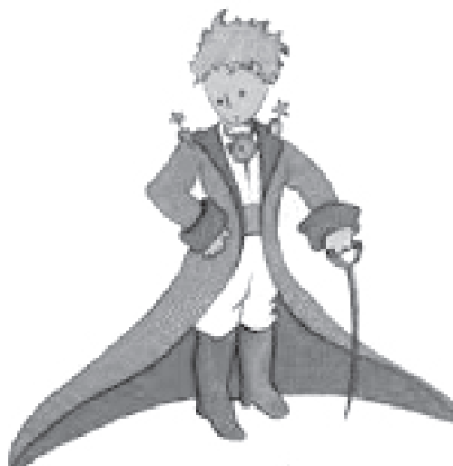
La Carta de la Tierra para niños en armenio, ruso e inglés.

Con hermosas fotografías y carteles dibujados por los alumnos, la Carta de la Tierra para niños se ha vuelto muy popular en las escuelas y jardín de niños de Armenia.