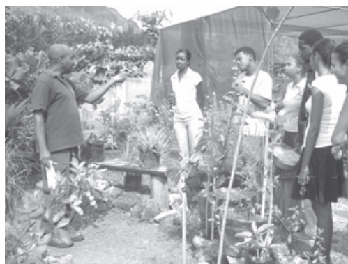
Práctica de campo. Curso NEEDO2.