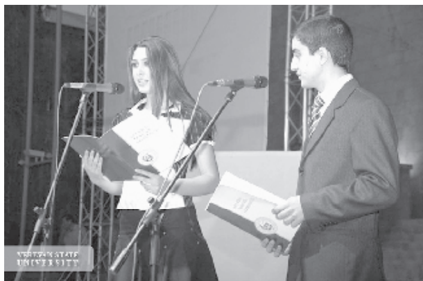
El juramento a la Universidad de los estudiantes de nuevo ingreso.

Ella comienza su curso dando un folleto de la Carta de la Tierra (en armenio, ruso e inglés) a los estudiantes para leerlo en casa. En el salón de clases la discusión es alentada. Y para facilitar el ejercicio de la práctica, ella divide al grupo en cuatro de acuerdo con los cuatro pilares de la Carta de la Tierra para discutir su parte con cada grupo. Después de la discusión todos los estudiantes presentan su parte, y comparte sus hallazgos y reflexiones con el grupo entero, lo que da pie a una discusión en cla-