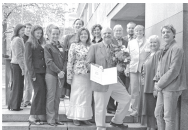
Cuarta Conferencia del DFPP, Helsinki, 1º de junio del 2006.

La mayoría de los patrones educativos occidentales simplemente refuerzan las prácticas y metodologías para equipar a los jóvenes para la nueva era informativa y la alta competencia en la economía. Este proceso de globalización de mercado afecta negativamente a la educación y entorpece el desarrollo sustentable. Para contrastar este canal, la Facultad de Educación y Gestión de la Universidad Daugavpils ha aumentado su compromiso del pro-