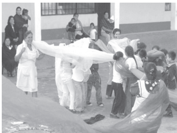
Actividades en la comunidad de Nocutzepo

tro, sonidos, pintura, baile y canto mientras sea parte de una historia —las puertas están abiertas.