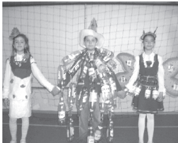
Mini proyecto Reciclaje gracioso: niños de tercer grado hacen representaciones teatrales.

En octubre del 2007, como proyectos complementarios, los ganadores del concurso para adolescentes participaron en una competencia en línea para diseñar el slogan y carteles para mostrar la mejora y efectividad de las actividades de conservación de la energía. La competencia en línea organizada por el proyecto internacional: "La energía es nuestro futuro" dentro de su sitio web, la cual está enfocada en apoyar la educación para la energía dentro del plan de estudios de las escuelas, ayudar a los maestros a aumentar la conciencia en sus alumnos acerca de la conservación de energía, entendiéndola y con énfasis en la importancia de la energía renovable. El proyecto busca inspirar a los estudiantes para que influyan en ellos mis-