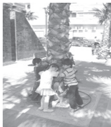
Actividades llevadas a cabo por un policía de Novelda - Alicante

Posteriormente, las secciones práctica y teórica comienzan: exposición, dinámica y ejercicios. El Modelo IDC (información-discusión-creación) con base en la dinámica de cooperación, y como manera participativa, en donde todos comparten sus experiencias personales y exploran casos reales. El taller resulta eminente-