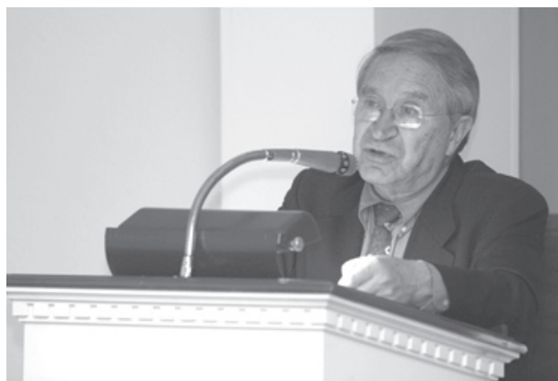
Homero Aridjis. Poeta mexicano en la Cátedra Extarordinaria Rachel Caron.

Dentro de otras iniciativas hemos desarrollado una “Guía para comer humana y sustentablemente con la Carta de la Tierra en la Universidad de la Costa del Golfo”. La Carta de la Tierra da una alternativa a la industria agrícola y a la explotación económica del trabajo y del medio ambiente, convocándonos a “adoptar patrones de producción, consumo y reproducción que salvaguardan las capacidades regenerativas de la Tierra, los derechos humanos y el bienestar de la comunidad” (principio 7). La Guía busca enlazar la ética de la Carta de la Tierra con