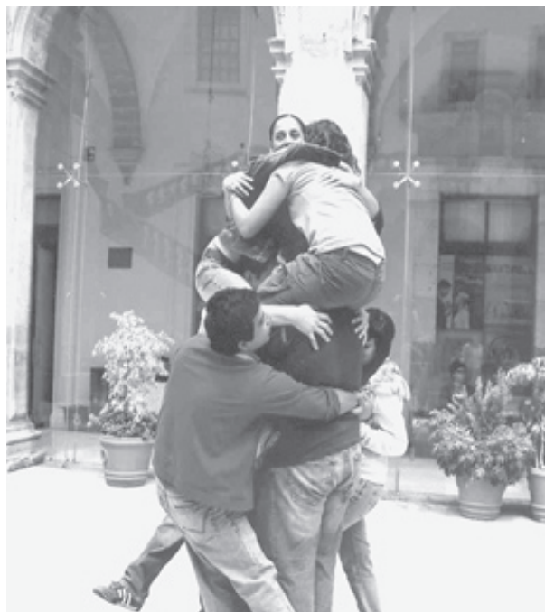
Taller de la Carta de la Tierra. Universidad de Guanajuato.

La siguiente tabla detalla el programa de un taller de la Carta de la Tierra de ocho horas. Las fases son iguales en las otras tres versiones del taller, sin embargo los ejercicios varían, así como el tiempo, que se ajusta de acuerdo con el objetivo del grupo.