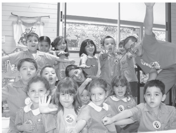
Un estudiante de la UNA CEG, trabaja con niños de preescolar.