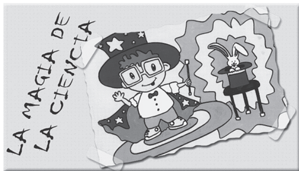
Proyecto “La Magia de la Ciencia”

La Feria de Juguetes está diseñada para ofreceres juguetes usados – en buenas condiciones, no-bélicos ni sexistas- a los niños. Este intercambio se hace posible gracias a donaciones de juguetes y en especie hechas por los estudiantes de la Facultad. Todos los juguetes entregados a la Feria son donados a escuelas con necesidades y a ONG.