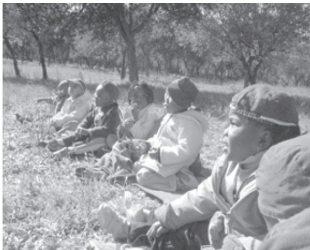
Viaje de campo al Parque Florestal Monsanto con una escuela primaria.

En consecuencia, ASPEA comenzó a recopilar información y recursos en forma sistemática a través de la página web de la Carta de la Tierra para acumular conocimiento sobre el concepto de sustentabilidad a través del documento. Se pusieron en marcha las iniciativas para el entrenamiento de educadores en las áreas de Medio Ambiente, Sustentabilidad, Ciudadanía y Arte. El Foro para jóvenes y niños, un evento anual llevado a cabo desde el año 2002 en Aveiro para celebrar el día de la Tierra (22 de abril), se dio a conocer como el Foro de la Carta de la Tierra para niños y jóvenes.