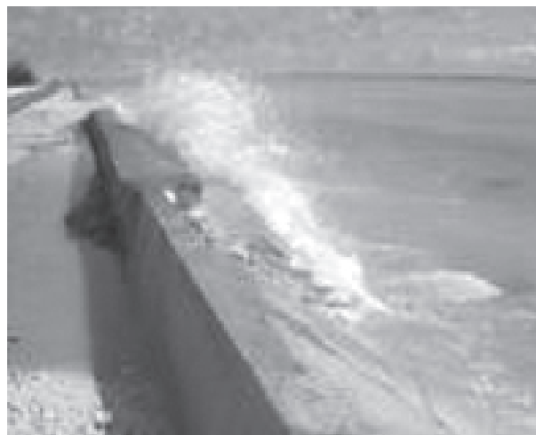
Ballenas en el recorrido de su ruta - Isla Kiribati.

Los ecolíderes recibirán apoyo por medio de un sistema de envíos por la red con el paquete “hágalo usted mismo” que comprende de un ciclo anual de cinco pasos, un marco de reconocimiento, aprendizaje de colaboración y un sistema de administración. Ser ecolíder es una actividad curricular voluntaria no obligatoria que opera bajo el apoyo de una escuela patrocinadora. Los estudiantes son apoyados por mentores voluntarios, maestros -padres y miembros de la comunidad- coordinados apropiadamente por la escuela. El programa comienza con un taller de un día entero involucrando a estudiantes con grupos básico de maestros, mentores y facilitadores. Hoy en día existe una escuela que está trabajando de esta manera: la escuela para niñas católicas: el Mercy College en Parramatta, Sydney, que contactó al centro ER e implemento su pro-