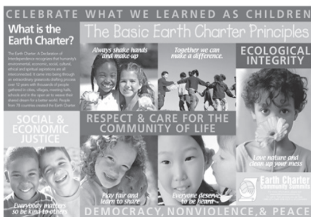
Ejemplo de un Cartel de la clase.

Creatividad mediante el arte y la ciencia. Expresar una visión personal de los principios a través de la fotografías, video, dibujos o pinturas, textos, experimentos sobre calidad del agua en la escuela o los niveles de contaminación local, entre otros.